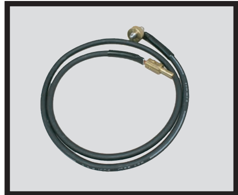
スタッド側の取付口 10パイメス用 型式：WME-12