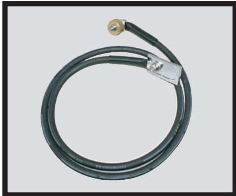
アースクリップ用 型式：WME-02